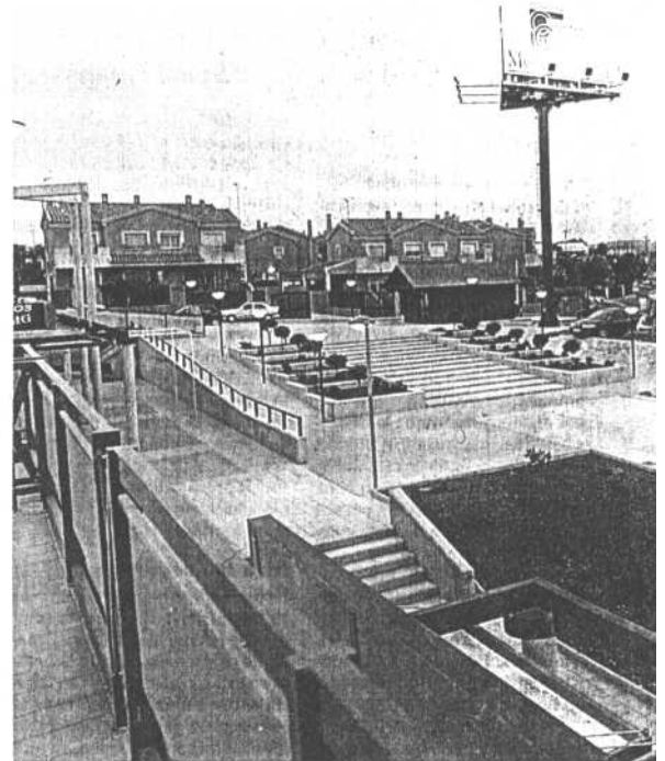
MONTEPINAR. Una imagen tomada ayer de la urbanización murciana, en que se levante el colegio privado.

Abellón puntualizó que «estamos en el momento preciso para que el alcalde deje en suspenso la adjudicación de la parcela y haga lo que dicen los vecinos: que ceda los terrenos a la Comunidad Autónoma para un colegio público».