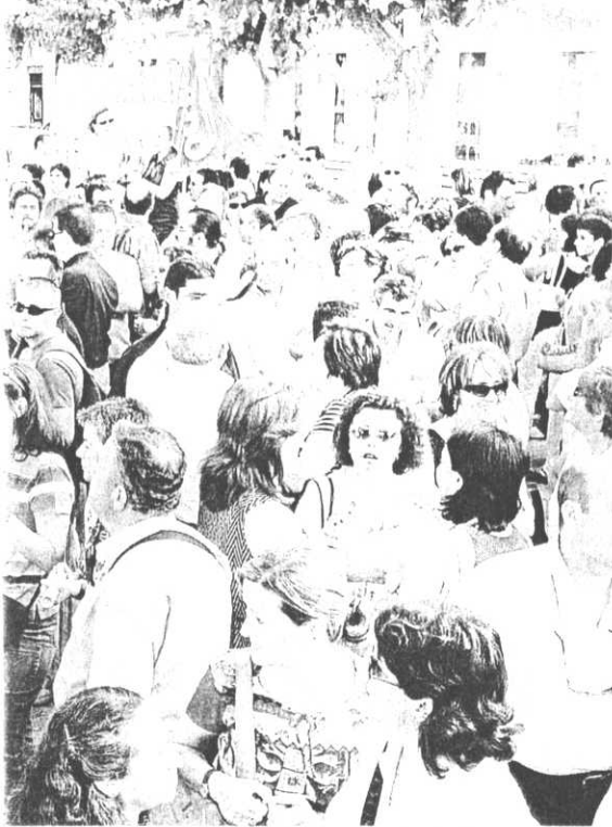
expresar su preocupación por el clima de violencia

Medina Precioso se mostró dispuesto a «escuchar y atender las reivindicaciones»