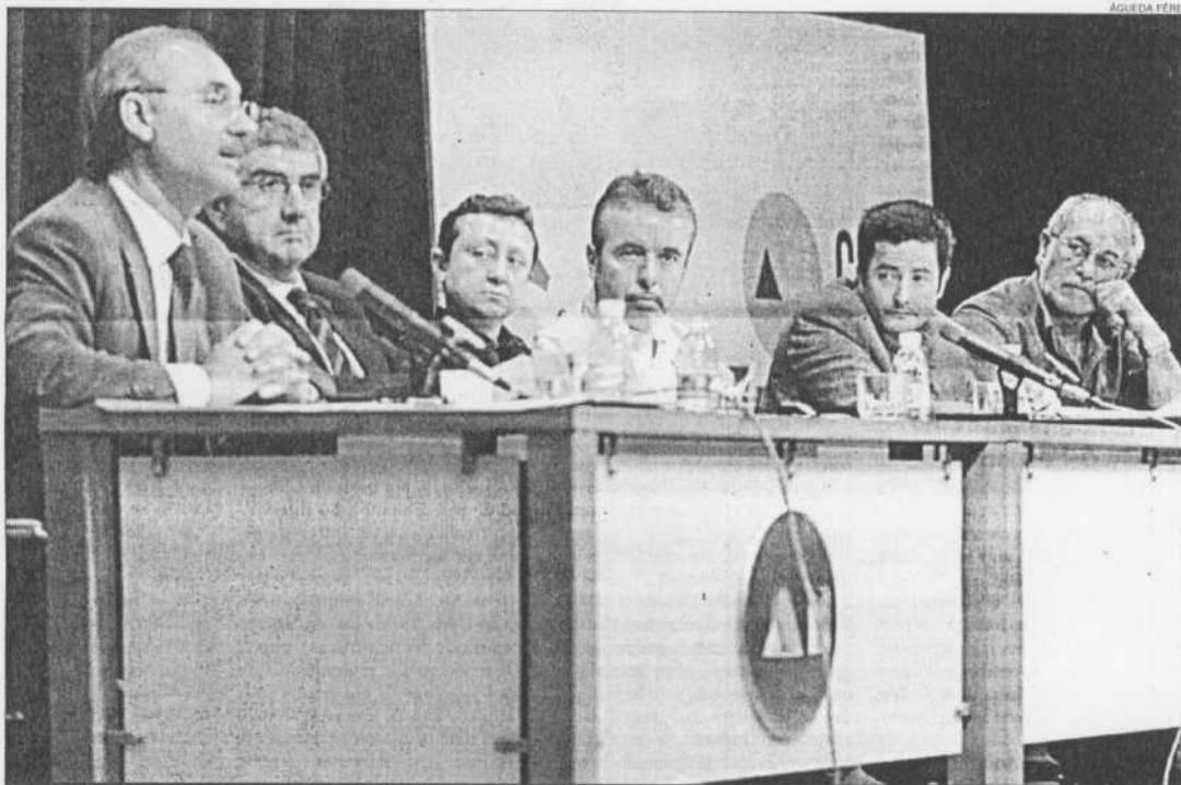
La mesa del Club LA OPINIÓN reunió a políticos y filósofos de la Región de Murcia para discutir sobre el futuro de la Filosofía

Los filósofos tienen la sensación de que están pagando los problemas de la enseñanza