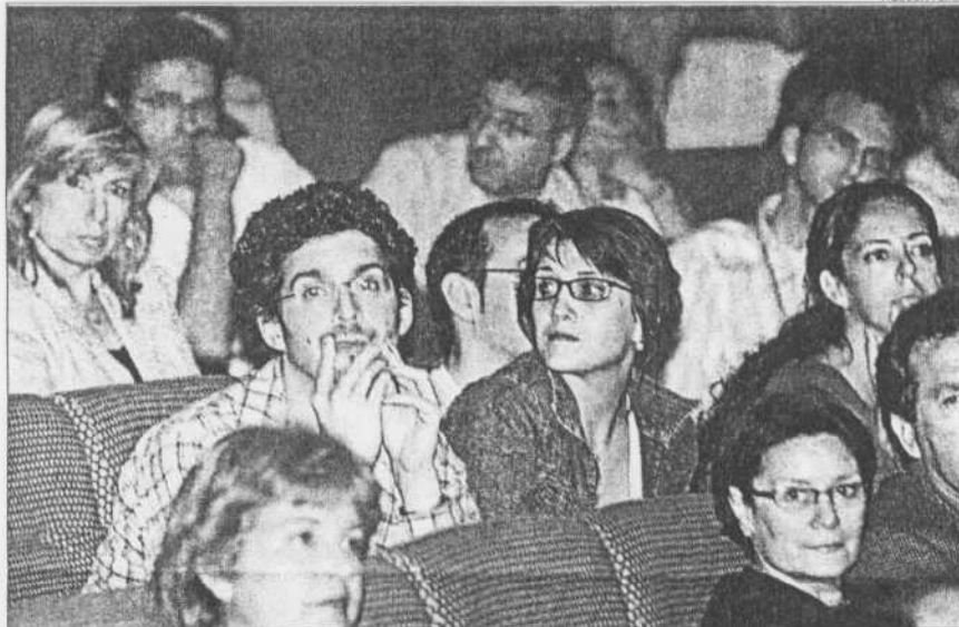
Muchos de los asistentes al debate eran estudiantes preocupados por su futuro laboral