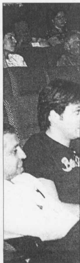
Entre el público que asistió el martes al debate